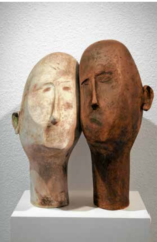
Uta Eckerlin, Ohne Wenn und Aber, Terracotta, 2013