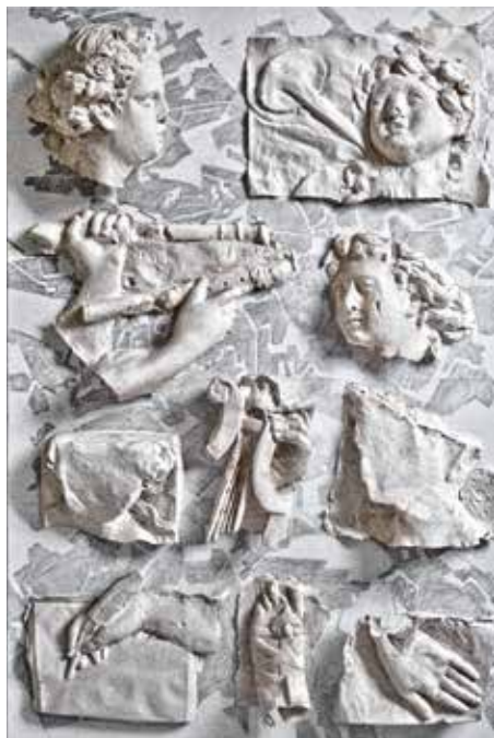
Astrid Weichelt, Verletzte Musen, Büttenpapier (Abformung), Zeichnung auf Leinwand, 2017