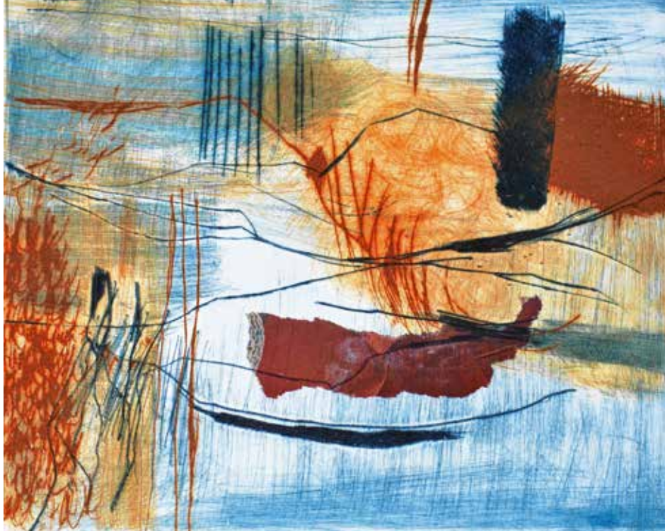
Karin Tiefensee, Es wird ein schöner Tag, zweifarbiger Tiefdruck mit Collage, 2016