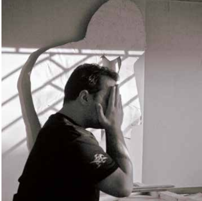
Liz Miels-Kratochwil, Die geschlossenen Augen, Fotografie, 2016