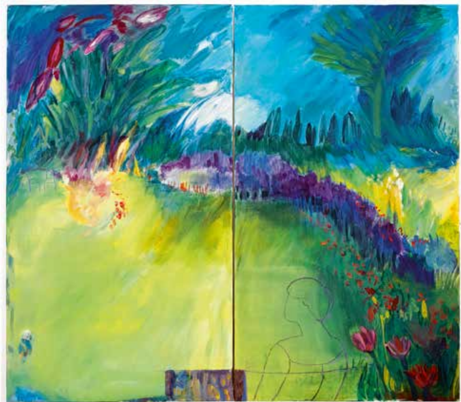
Irmgard Merkens, Im Park, Mischtechnik auf Leinwand, 2009