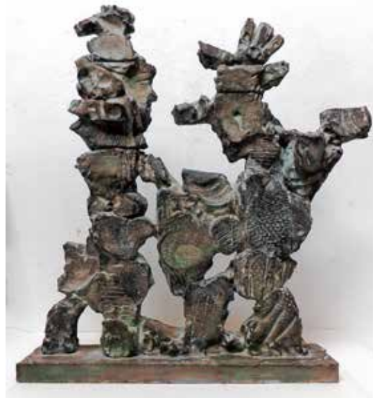
Sonja Eschefeld, Begegnung II, Beton, 2016