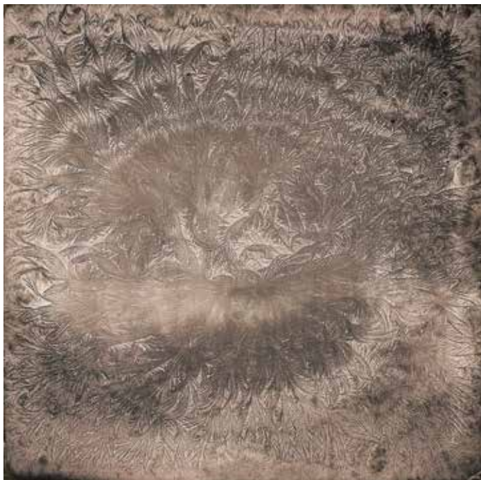
Gudrun Schlemmer, Winterensemble 3, Acryl auf Leinwand, 2017