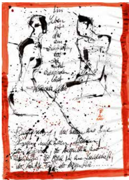
Jutta Schölzel, mit-teilen, Blatt 2, Tusche auf Papier, 2017