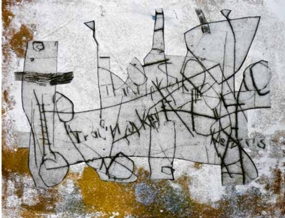
Elke Pollack, o.T. (Aufbruch), Mischtechnik auf Papier, 2017