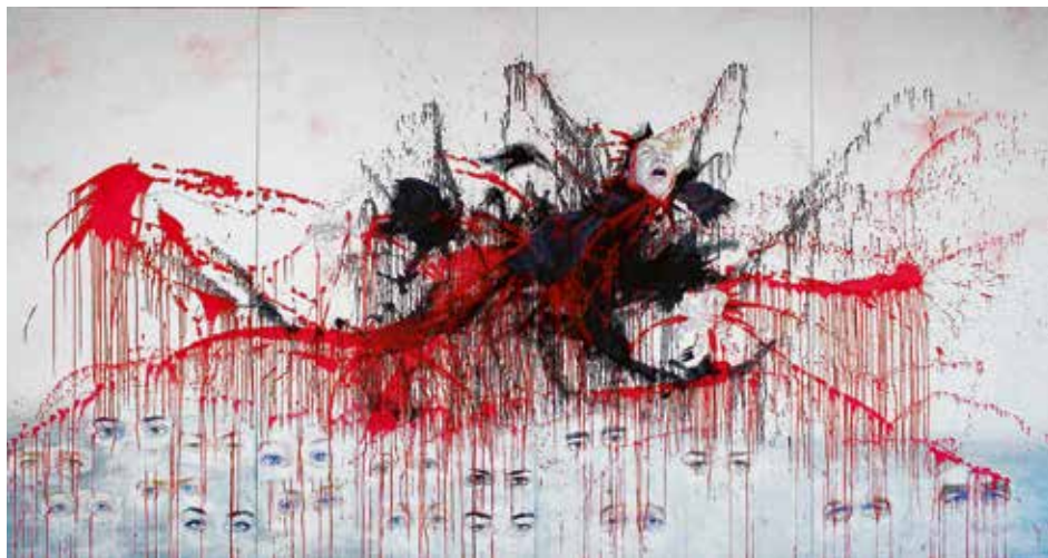
Bettina Mundry, Terror – aus der Serie Extremismus, Öl auf Leinwand, 2016