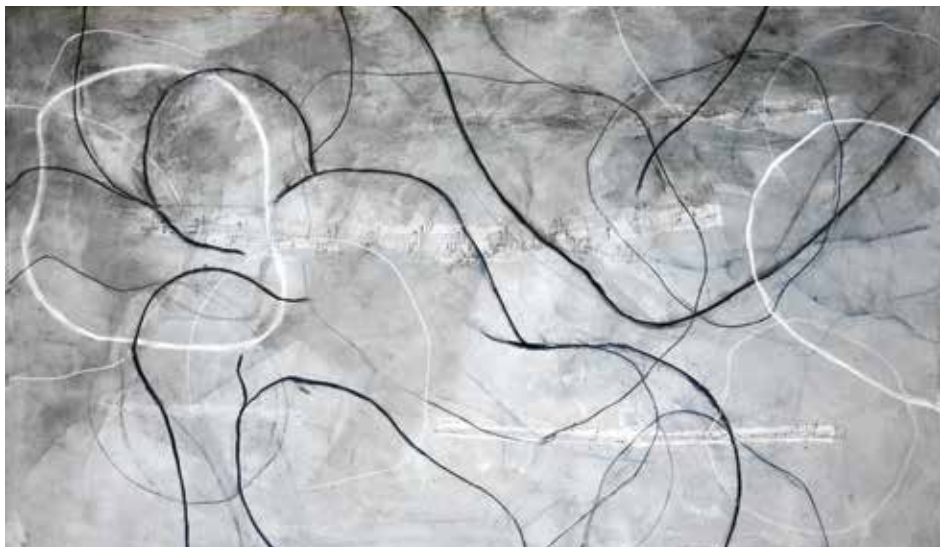
Christine Düwel, Gegensätze C1, Zeichnung und Mischtechnik auf Papier, 2017