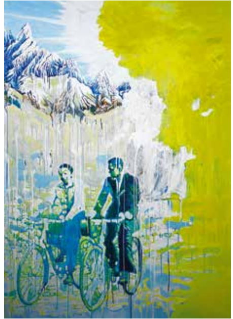
Cornelia Schlemmer, Träumen vom Honigmond, Acryl auf Leinwand, 2017