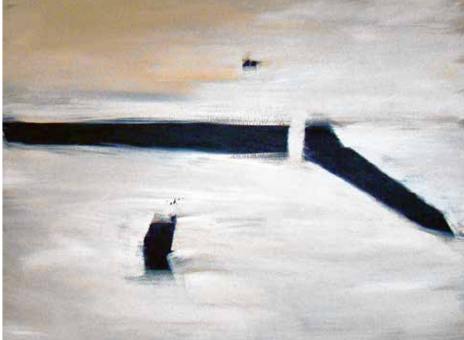
Christine Hielscher, o. T., Acryl auf Leinwand, 2017