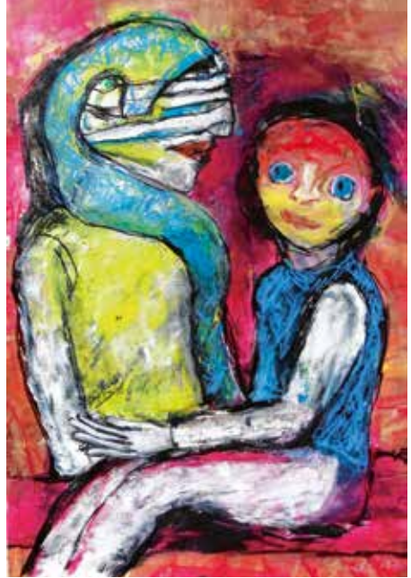
Linde Kauert, Persona ingrata, Gouache, Kohle, Wachsmalstifte auf Papier, 2017

1953 geboren in Rathenow, 1971 – 1975 Studium Realistisches Gestalten, Kunstgeschichte und Germanistik in Erfurt (Diplom), 1987 – 1990 Abendstudium an der Kunsthochschule Berlin-Weißensee und gleichzeitig Ausbildung an der »Spezialschule Plastik« der Bezirkskulturakademie Berlin, 1996/97/99/2000 Teilnahme an den Sommerakademien in Marburg - Freie Malerei, 1995 – 1997 postgraduales Studium Künstlerweiterbildung an der Hochschule der Künste Berlin, 2001 – 2004 Freie Malerei und Studium der Kunsttherapie in Berlin (Artpsychotherapeut), seit 2004 Bildnerische Gestaltung