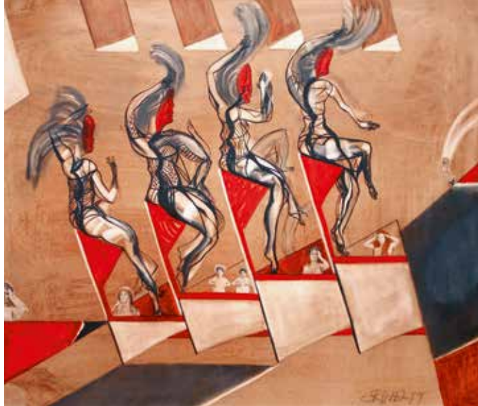
E.R.N.A., Teatime I – Girls, Tee, Tusche, Grafit auf Leinwand, 1999/2000