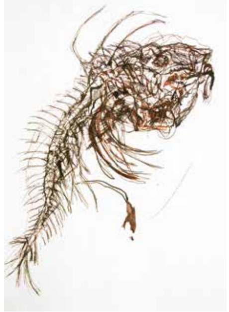
Karin Gralki, Das Abendmahl, Rohrfeder, Bister, 2017