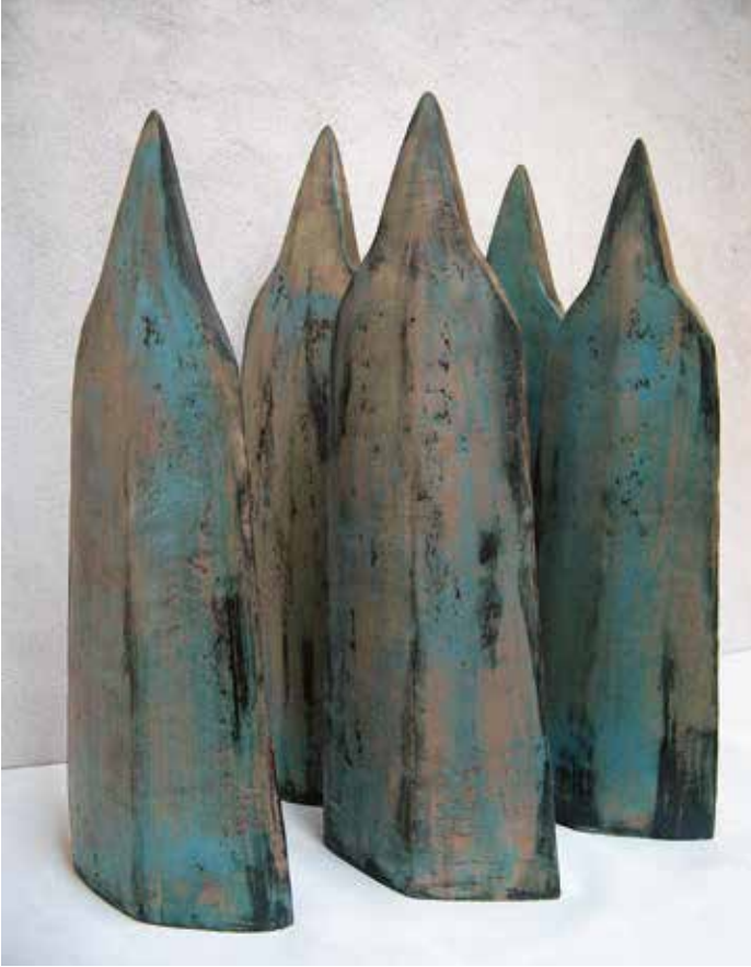
Corinna Dahme, Jedermann autark, Ton, Engobe, Oxyd, Glasur, 2015