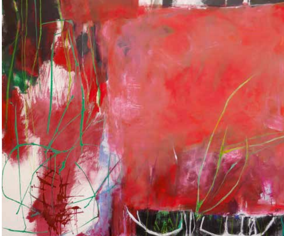
Anne-Françoise Cart, Naturelines I, Acryl-Mischtechnik auf Leinwand, 2017