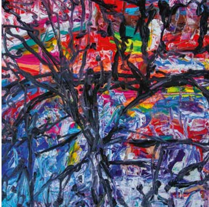
Marianne Gielen, Magnetfelder 3, Acryl auf Leinwand, 2016