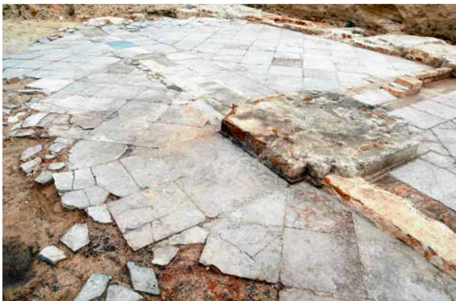
Archäologisch gesichert: der Steinfußboden aus dem Speisesaal des Großen Kurfürsten aus dem 17. Jahrhundert. Im Landtagsgebäude ermöglicht ein „Archäologisches Fenster“ den Einblick auf das geschichtsträchtige Bodendenkmal.

auf die doppelte Länge erweitert wurde. Der Hauptbau wurde dreigeschossig ausgebaut. Mit dem vergrößerten und neu gestalteten „Lustgarten“ wurde das Schloss zu einer repräsentativen Residenz und nahm eine beherrschende Stellung am bürgerlichen Zentrum, dem Alten Markt, ein. Das Stadtschloss hatte damit die flächenmäßige Ausdehnung im Stadtraum erreicht, die bis zum Abbruch 1959/60 bestand und jetzt wieder vom Landtag eingenommen wird.