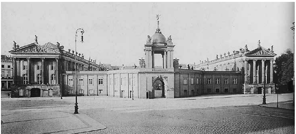
Das historische Potsdamer Stadtschloss

Der Soldatenkönig fasste wegen der äußerst schlechten Staatsfinanzen, die ihm sein Vorgänger hinterlassen hatte, den Entschluss, möglichst viele seiner Schlösser zu verkaufen und nur wenige zu behalten. Das Potsdamer Stadtschloss war eines der wenigen Schlösser, das in seinem Besitz verblieb, doch nutzte er es im Unterschied zum Schloss Charlottenburg nicht zu Repräsentationszwecken, sondern nur als Wohnstätte für seine Familie. Der Saal im Kellergewölbe wurde 1726 zu einem Weinkeller umgestaltet und im Übrigen am Schloss nur kleine Reparaturen durchgeführt, während der König Potsdam zur Garnisonsstadt ausbaute. Die