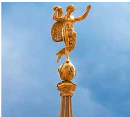
Die Fortuna schwebt wieder vor dem Potsdamer Himmel.

Eine Initialzündung für die Realisierung stellte das „Potsdam Project“ der Sommerakademie für junge Architekten des Londoner Architekturinstituts von Prinz Charles dar („The Prince of Wales’s Urban Design Task Force, Potsdam and Bornstedt 1996“). Am 25. März 1999 wurde der Förderverein für den Wiederaufbau des Fortunaportals gegründet, von dem nach der Sprengung nur das Fundament und ein paar unter der Erde verborgene Fußplatten erhalten waren. Der Wiederaufbau wurde in traditioneller Bautechnik und unter Verwendung der erhaltenen Originalteile realisiert. Nach dem ersten Spatenstich am 8. September 2000 konnte die feierliche Einweihung am 12. Oktober 2002 erfolgen.