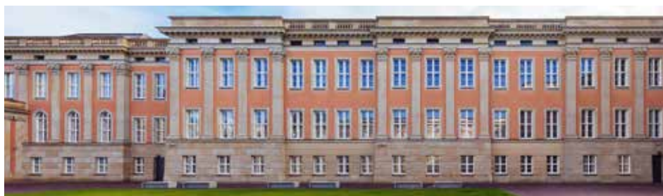
Die Fassade des Ostflügels vom Innenhof aus gesehen

den Antrag ins Plenum einbrachte, den über der Bronzetür angebrachten weißen Adler durch das Landeswappen zu ersetzen, beschloss die Mehrheit auf Antrag der Koalitionsfraktionen im Einvernehmen mit dem Architekten am 15. Mai 2014, den weißen Adler zu entfernen und einen roten mit dem Schriftzug „Landtag Brandenburg“ am Rednerpult anzubringen. 7