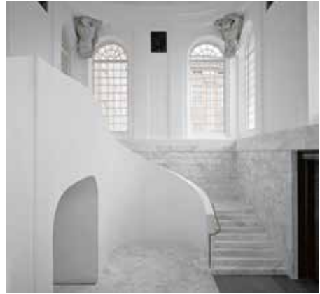
Das Knobelsdorff-Treppenhaus im Landtagsgebäude

Die Farbgebung orientiert sich mit dem verwendeten Rotockerton an den