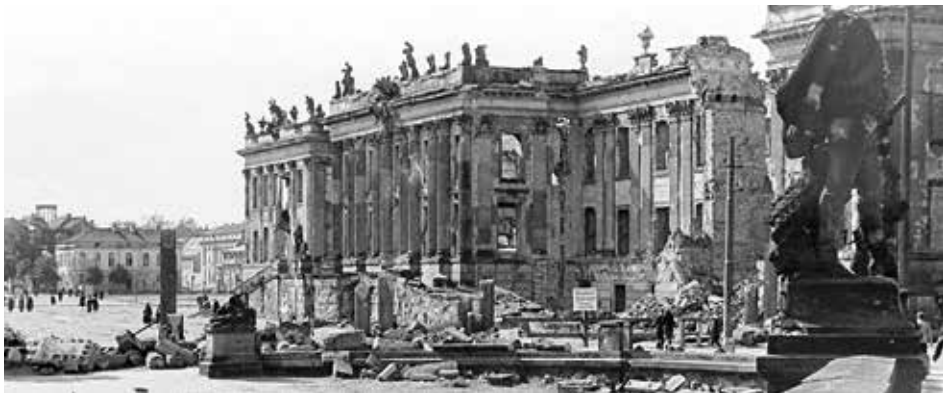
Das zerstörte Potsdamer Stadtschloss

In der Weimarer Republik saß hier der Magistrat; seit dem 10. September 1920 tagte im neuen Schlosssaal die Stadtverordnetenversammlung. Im Gebäude wurden Dienstwohnungen geschaffen und waren das Arbeitsamt und zum Teil die Stadtverwaltung untergebracht.