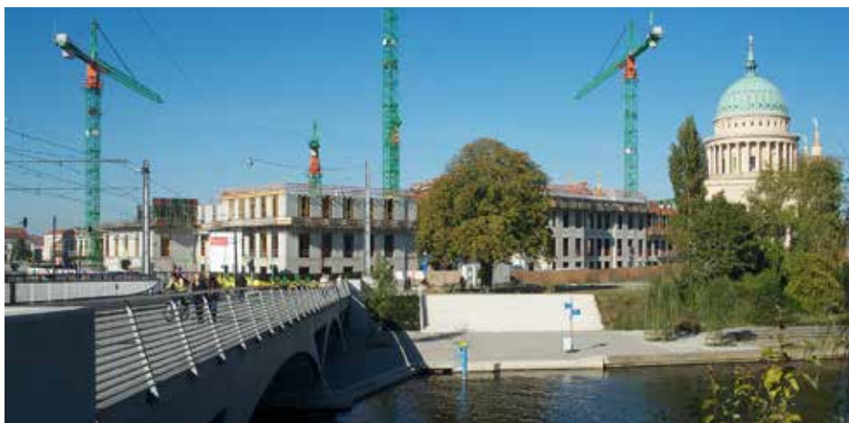
Blick auf die Baustelle des Landtagsgebäudes

steinzeitliche Gräber und Erdwerke, eine germanische Siedlung, in der Eisen verhüttet wurde, Ackerspuren aus der Zeit des slawischen Burgortes Poztupimi, eine bisher unbekannte mittelalterliche Wehranlage mit hölzernem Turm und Wassergraben und völlig neue Erkenntnisse zu den Burg- und Schlossanlagen des 16. bis 18. Jahrhunderts sind archäologisch untersucht und dokumentiert worden.