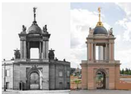
Gegenüberstellung des historischen und des im Jahr 2002 wiedererrichteten Fortunaportals

mermonaten als angenehm kühler Speisesaal zur Verfügung stand, aber auch als Aufbahrungsort für verstorbene Angehörige der kurfürstlichen Familie genutzt wurde.