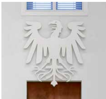
Die ursprünglich im Plenarsaal angebrachte Darstellung eines weißen Adlers

der Knobelsdorff-Originaltreppe vor, die dem auch zustimmte. Auch wenn zuvor angekündigt worden war, das Treppenhaus weitestgehend historisch mit Originalteilen herzurichten, folgten die Abgeordneten der Argumentation des Architekten, dass das Treppenhaus der Übergang zwischen der historischen Außenfassade nach Knobelsdorff und dem modernen Parlament im Inneren sei, nach seinen Worten „der Übergang in die sachliche, einfache Welt.“