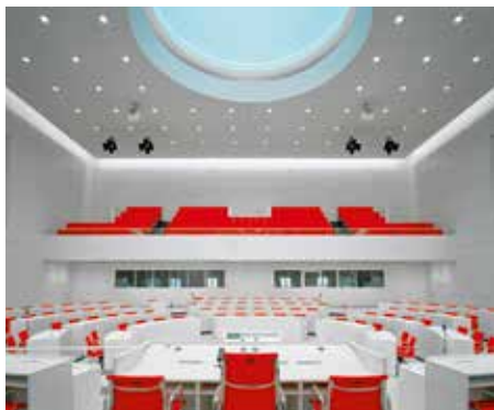
Blick vom Sitzungspräsidium auf die Besuchertribüne im Januar 2014