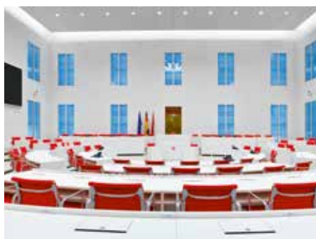
Der Plenarsaal des Landtages Brandenburg im August 2014

Direkt darüber, im 1. Obergeschoss , befindet sich das Herzstück des Gebäudes, der Plenarsaal (früher Festsaal/Marmorsaal) sowie der Präsidialbereich mit dem Büro des Landtagspräsidenten bzw. der Landtagspräsidentin. Zu einem heftigen Streit führte, dass die Kunstkommission des Landtages dem Vorschlag des Architekten gefolgt war, im Plenarsaal einen weißen und nicht – dem Wappentier des Landes Brandenburg entsprechend – einen roten Adler anzubringen. Während die CDU-Fraktion