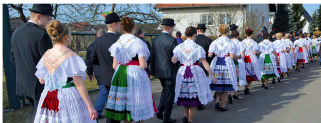
Žowća a gólcy w rejowańskej drastwje Dolnołužyskich Serbow / Mädchen und Jungen in der Tanztracht der Sorben/Wenden in der Niederlausitz

Rada za nastupnosći Serbow stwóriť. Wóna pórażujo krajny sejm, kněžařstwo a zastojnstwa, gaž su serbske nastupnosći pótrjefjone.