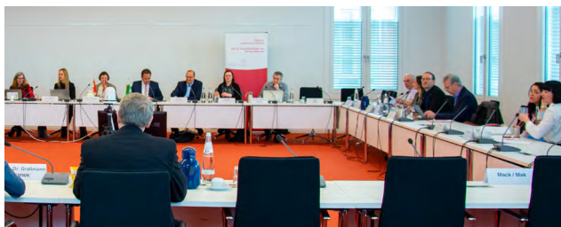
3. póseženje RASW dnja 25.03.2025 / 3. Sitzung des RASW am 25.03.2025

In der Lausitz siedelt seit mehr als 1.000 Jahren das Volk der Sorben/Wenden. Beide Bezeichnungen werden heute als Synonym gleichberechtigt für die Angehörigen dieses westslawischen Volkes verwendet. Das so genannte angestammte Siedlungsgebiet der Sorben/Wenden im Land Brandenburg befindet sich in den Landkreisen Dahme-Spreewald, Oberspreewald-Lausitz und Spree-Neiße/Sprjewja-Nyssa sowie der kreisfreien Stadt Cottbus/Chóšebuz. Darüber hinaus leben Sorbinnen/Wendinnen und Sorben/Wenden im gesamten Bundesgebiet. Bis zur Gegenwart haben sie ihre Sprache und ihr Brauchtum er-