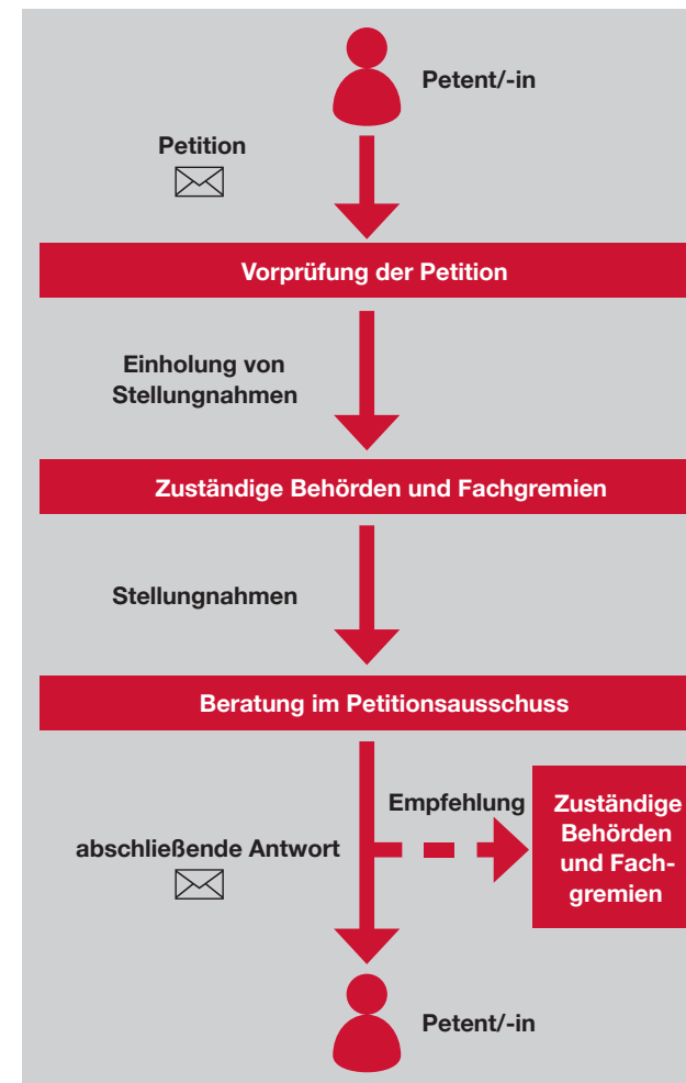
Schema des Petitionsverfahrens im Landtag Brandenburg